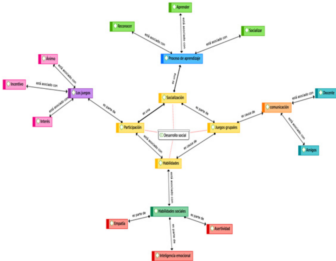
Figura 4. Red semántica - Desarrollo social